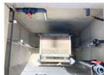
中水利用システム

新社屋は環境に配慮した設計で、地中熱利用の冷暖房システムや太陽光発電と組み合わせたトライブリッド蓄電システムなどを備えております。また、効率を高めるために建物全体を超高断熱の仕様としました。そのほかにも木造軸組による鉄骨躯体のヒートブリッジ(熱橋)を防止するなど、建築的手法により省エネ配慮をおこなった建物になります。